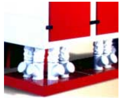
Abb. 2 Auslauf / Fig. 2 Sortie