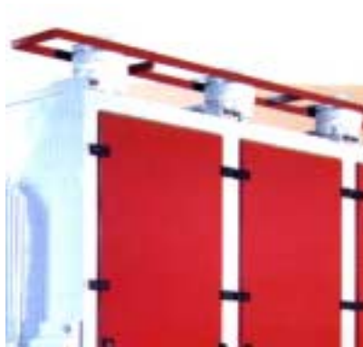
Abb. 1 Einlauf / Fig. 1 Entrée