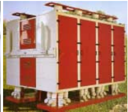
Müllereigewebe aus Polyamid/Nylon Tissu en polyamide/nylon