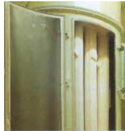
Anwendung / Application

Abb. 1 Filterschläuche für diverse Filteranlagen