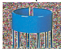
b) Offen mit Innenlippe b) Ouvert avec lèvre intérieure