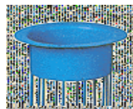
c) Mit Flansch c) Avec collerette