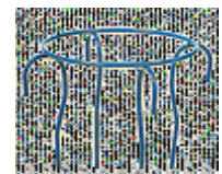
e) Profildraht e) Fil profilé