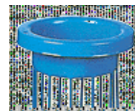
d) Mit Flansch und Rand d) Avec collerette et bordure