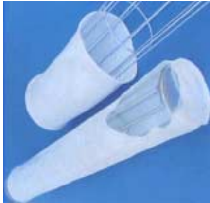
Abb. 2 / Fig. 2