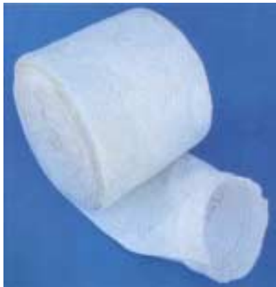
Abb. 1 / Fig. 1

Filterschläuche für diverse Filteranlagen und Filterkörbe zur Formhaltung der Schläuche Manches filtrantes pour des installations de filtrage variées et cages de manche pour le support des manches