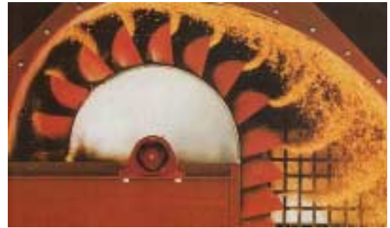
Anwendung / Application