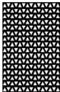
III. 7 / Fig. 7