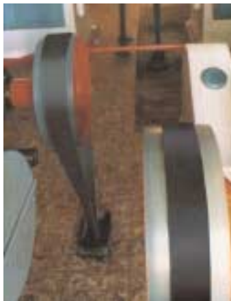
Pict. 2 Roller mill drive / Fig. 2 Comando laminatoio