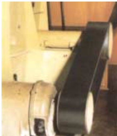
Pict. 1 Ventilator drive / Fig. 1 Comando di ventilatore

High duty flat belts for driving roller mills, ventilators and other machinery and apparatus of the milling industry Cinghie piane ad alto rendimento per il comando di laminatoi, ventilatori ed altre macchine ed attrezzature dell'industria molitoria