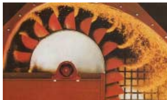
Application / Applicazione